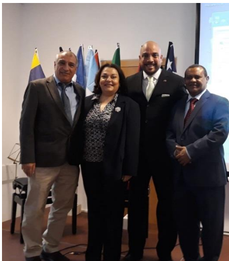
Semana Latinoamericana