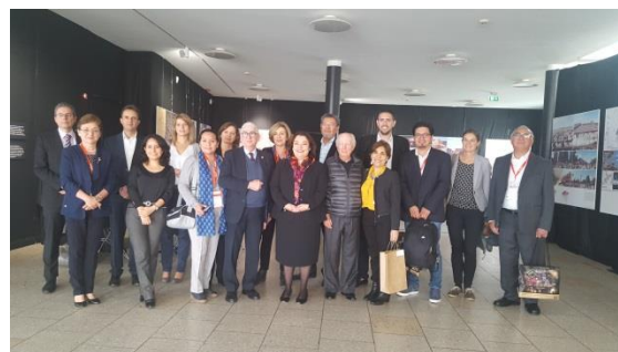
Clausura de "Unlake City, Where there was a Lake, now there is a City"

Dicha exhibición da cuenta de la condición geográfica y arquitectura de la Ciudad de México. Así, a través de mapas, planos, imágenes y videos, la muestra constituye un viaje del pasado al futuro de la ciudad en el que se puede apreciar la transformación del Valle de México a través de los siglos.