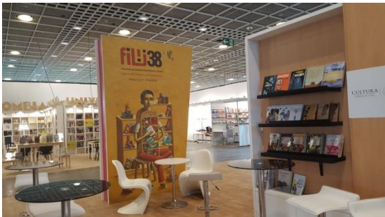
Pabellón de México en la Feria Internacional del Libro en Fráncfort