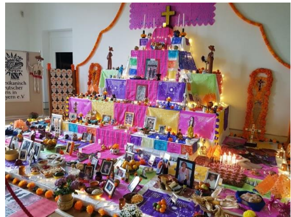
Ofrenda del Día de Muertos en el Museo de los Cinco Continentes

la jornada se contó con la presencia de 2,822 visitantes en el Museo de los Cinco Continentes que acudieron para participar en esta fiesta comunitaria y cultural.