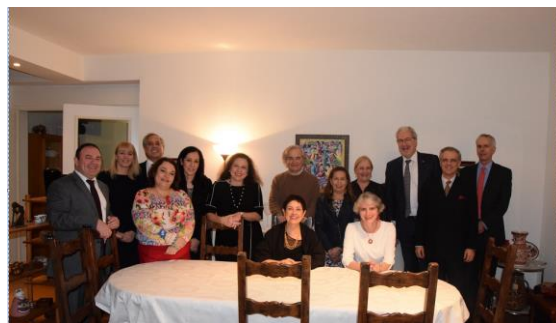
Cónsules de Iberoamérica

El 30 de noviembre, la Cónsul participó en el encuentro mensual de los cónsules de carrera de Iberoamérica acreditados en Hesse, que busca vínculos de colaboración entre la comunidad latinoamericana y española.