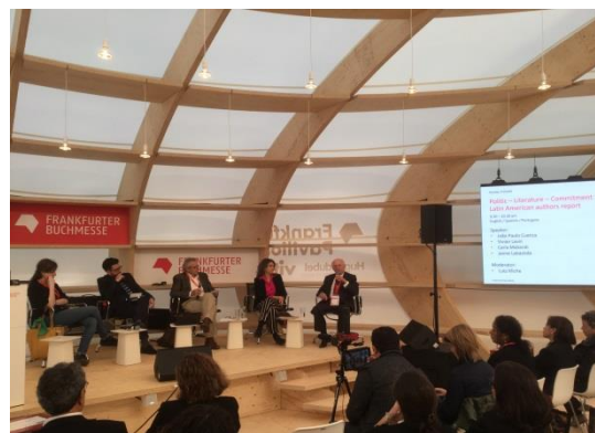
Dr. Jaime Labastida en el panel "Política, literatura, compromiso"