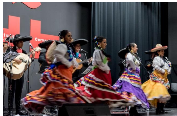
Adelitas Tapatías