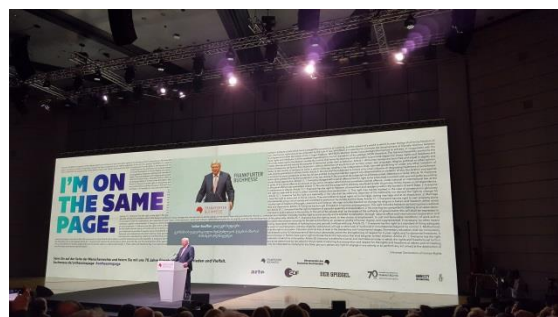
Volker Bouffier, Ministro Presidente de Hesse