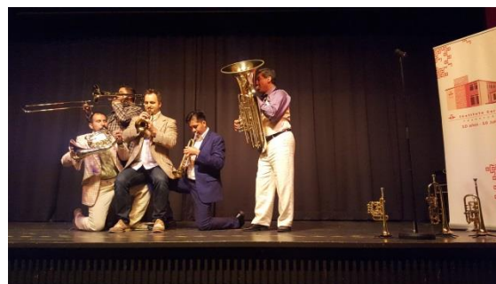
M5 Mexican Brass

En el marco de la Semana Latinoamericana, los días 22 y 23 de octubre, se presentó en concierto el quinteto mexicano de alientos “M5 Mexican Brass” con gran éxito. La calidad musical expuesta por el quinteto mexicano, fue apreciado por un numeroso público. El quinteto es uno de los más destacados internacionalmente, realiza giras regulares a Alemania y en general a América Latina, Canadá, Estados Unidos, Europa y Asia.