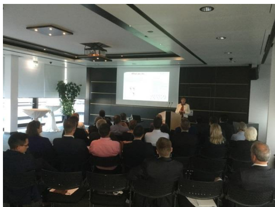
Seminario de Economía

Entre las diversas actividades, destacó un seminario de promoción económica en el Banco de Baden Württemberg, en el que la Cónsul Villanueva habló sobre las negociaciones del nuevo TLCAN y la situación política y económica de nuestro país. La discusión posterior se centró en el sector automotriz y los beneficios que ofrece el mercado mexicano.