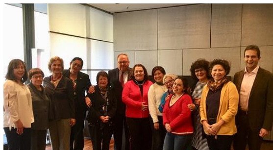
Encuentro con la Comunidad Mexicana en Renania del Norte- Westfalia

En dicho encuentro participaron la ex Presidenta y miembros de la Asociación Cultural Mexicana en Renania del Norte-Westfalia y algunas integrantes del grupo de baile "Viva México - Düsseldorf".