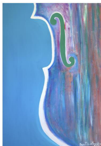
Sarit Lichtenstein Hommage an Yehudi Menuhin - The Sound of Color, 2016 Galerie AM PARK

Desde 1991 es miembro de la Asociación de Pintores y Escultores de Israel y desde 2008 de la Asociación de Artistas Plásticos de Garza García, México.