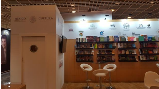
Pabellón de México en la Feria Internacional del Libro en Fráncfort