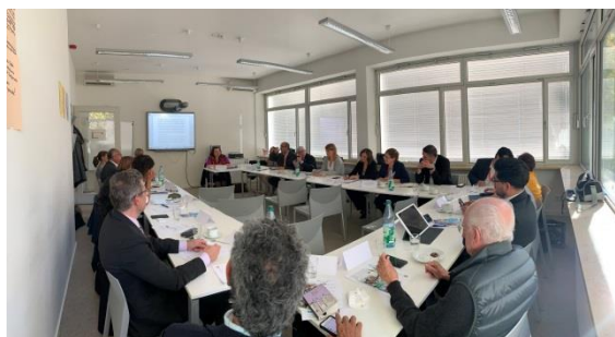
Mesa redonda sobre cooperación académica.

de Educación Superior de México y Alemania”, en la que se contó con la participación de numerosas instituciones mexicanas y alemanas. Por parte de las universidades alemanas, se contó con ponentes representantes de la Universidad Goethe de Frankfurt, la Universidad Johannes von Gutenberg de Mainz, la Universidad de Stuttgart, el Servicio de Intercambio Académico (DAAD) y el Centro Universitario de Baviera para América Latina (BAYLAT). Las universidades mexicanas participantes fueron, la Universidad Autónoma de Aguascalientes, Universidad Autónoma de Sinaloa, Universidad de Sonora, Universidad Autónoma de Nuevo León, Universidad Autónoma de Hidalgo, Universidad Anáhuac, Universidad Iberoamericana, el Instituto de Investigaciones Dr. J.M.L. Mora y el Colegio de Postgraduados.