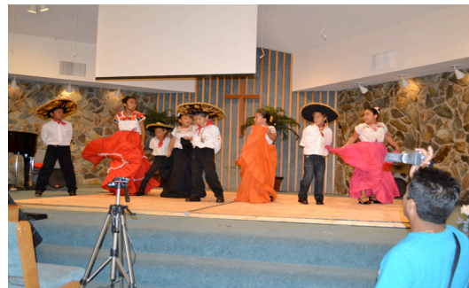
Niños del “Campamento de Verano en Clearwater”