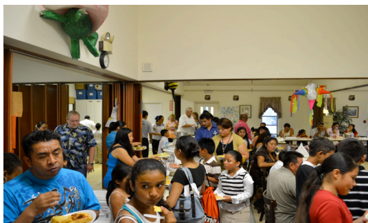
Convivencia en la clausura del “Campamento de Verano en Clearwater”

El 29 de julio se desarrolló la ceremonia de clausura del “Campamento de Verano” en el que 60 niños de Clearwater convivieron y aprendieron sobre sus costumbres y retomaron los lazos que los identifica y une con México.