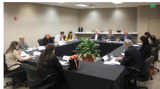
Reunión con Cónsules latinoamericanos en Atlanta y funcionarios de ICE