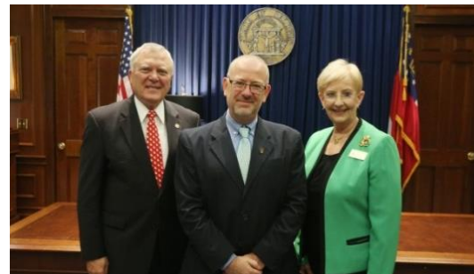
Reunión con el Gobernador de Georgia Nathan Deal y la primera dama de Georgia Sandra Deal.