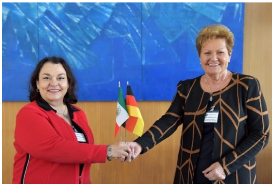
Cónsul Villanueva y Ministra Bachmann

El 5 de octubre, la cónsul Cecilia Villanueva participó, junto con la ministra de Salud del estado del Sarre, Monika Bachmann, en la ceremonia de bienvenida del personal médico mexicano que se incorporó a la Clínica de Saarbrücken en el marco del proyecto piloto "Specialized" que instrumenta la Agencia Federal del Trabajo de Alemania.