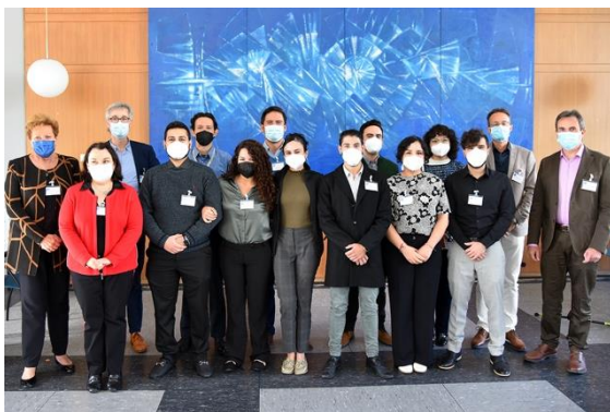
Encuentro con personal médico mexicano