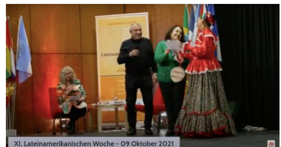
XI. Lateinamerikanischen Woche - 09 Oktober 2021