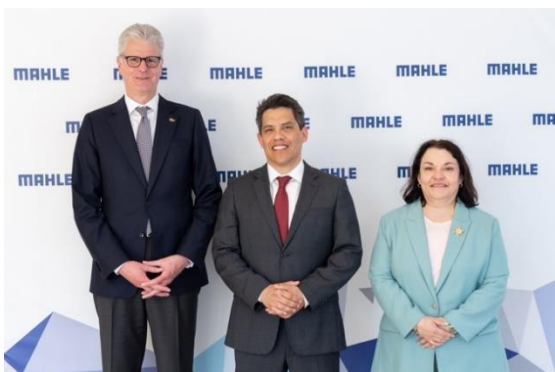
Visita a Mahle.

Con los interlocutores estatales se coincidió en la importancia de continuar desarrollando los vínculos políticos, económicos, turísticos y culturales con México, en beneficio de la internacionalización de ambas partes.