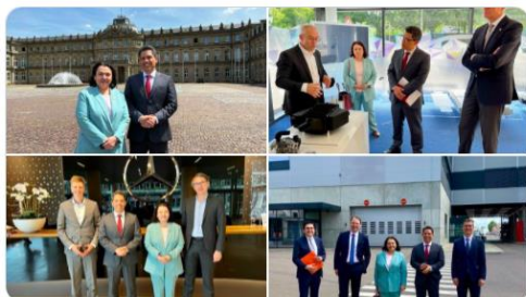
Landesregierung BW und 9 weitere Personen

Cecilia Villanueva @CeciliaVB_Mx · 21. Mai Esta semana tuve el gusto de acompañar a embajador @PacoQuiroga @EmbaMexAle en visita de cortesía al gobierno de Baden-Württemberg #Stuttgart y encuentros con empresas 🇩🇪 con fuertes negocios e inversión en 🇩🇪: Mahle, Mercedes Benz y Porsche #ImpulsoGlobal @SRE_mx @ConsulMexFrk