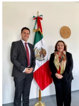
Cónsul Villanueva y el nuevo Cónsul General de Chile.