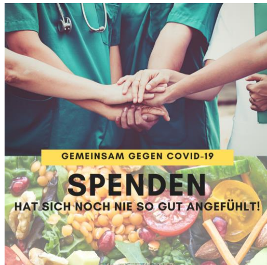
GEMEINSAM GEGEN COVID-19

Ayúdanos a ayudar, estamos seguros que con tu apoyo podremos continuar haciendo una diferencia todos unidos por una causa común.