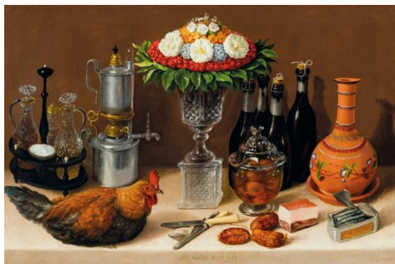
Cuadro de Comedor: José Agustín Arrieta, 1840/1860. Crédito foto: Google Arts & Culture Fuentes: Museo Soumaya ; Google Arts & Culture ; México: Siglo XIX, Museo Soumaya