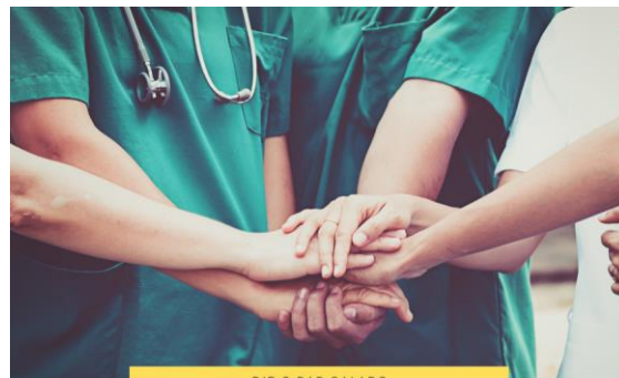
DIE S BAR SALADS

Estamos trabajando en la búsqueda de ayuda para difundir nuestra iniciativa y recibir más apoyo por medio de donaciones y así alcanzar la meta de donar 500 ensaladas.