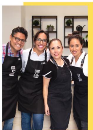
DIE S BAR TEAM

Así como Múnich nos abrió las puertas, nosotros con nuestro esfuerzo abrazamos a la ciudad donando 500 ensaladas y bowls a médicos & enfermeras quienes están combatiendo al COVID-19