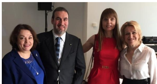
Cónsul Villanueva con el Cónsul de Italia y su esposa, y la Cónsul de Grecia, en la fiesta nacional de Italia

Tengo el gusto de saludarlos y presentarles nuestro boletín del mes de junio. En este mes destaca la visita del gobernador de Baja California, Francisco Vega de Lamadrid. En el área de documentación resalta La Jornada Sabatina ofrecida el 1º de junio. Asimismo, durante este mes sobresalen el encuentro con la Comunidad Mexicana de Fráncfort y la inauguración de la exposición "Colisión: Aztecas 1519 Españoles".