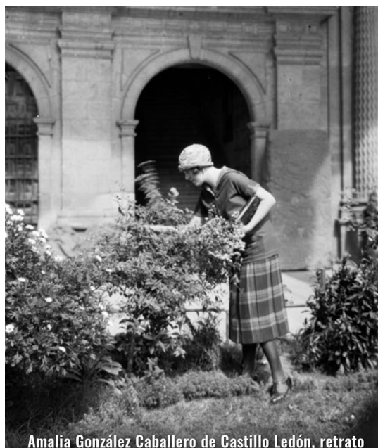
Amalia González Caballero de Castillo Ledón, retrato

Conversatorio sobre Amalia González Caballero de Castillo