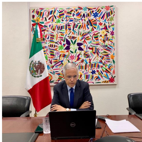
Subsecretario de Relaciones Exteriores, Emb. Julián Ventura.

Ambas partes llevaron a cabo un balance del trabajo logrado conjuntamente durante los últimos años en el marco de la Asociación Estratégica México-UE (2008) y del proceso para modernizar el "Acuerdo Global" México-UE. En consecuencia, se acordó acelerar los procedimientos internos para la firma de la modernización del Acuerdo Global México-UE a finales de 2020 o principios de 2021.