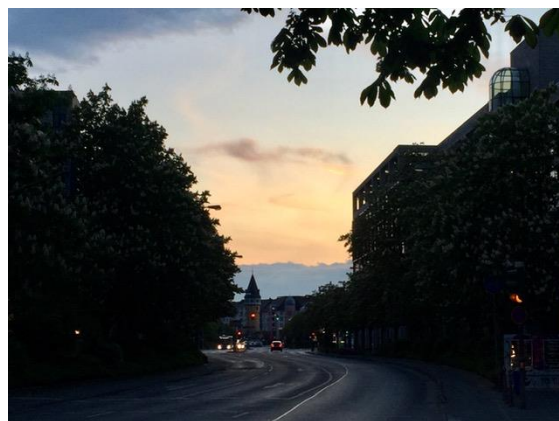
Frankfurt am Main, anochecer en Westend, al fondo la torre de Bockenheimer Warte. Abril de 2020.

Finalmente, les comparto una foto del atardecer en Frankfurt, captada durante un paseo en el abril pasado.