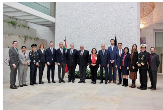
Reunión con Cónsul Honorario en Embamex Alemania