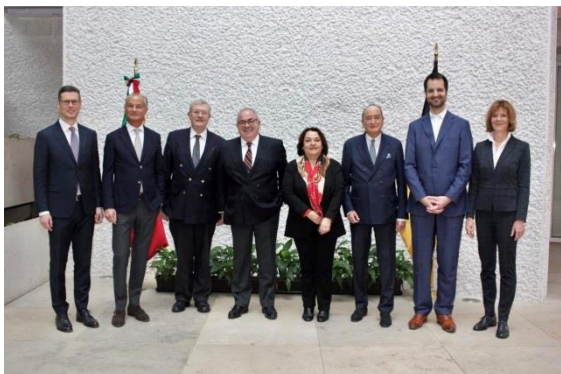
Reunión con Cónsules Honorarios en Embamex Alemania.