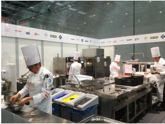
Participación de México en la Olimpiada Culinaria IKA