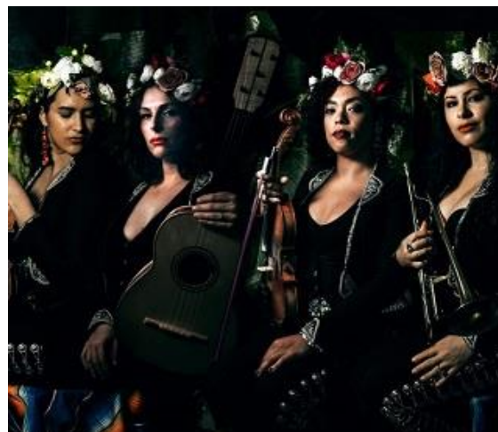
Flor de Toloache.

El 14 de mayo del presente, el mariachi femenino Flor de Toloache iniciará una gira por Europa en donde se incluyen diversas ciudades en Alemania.