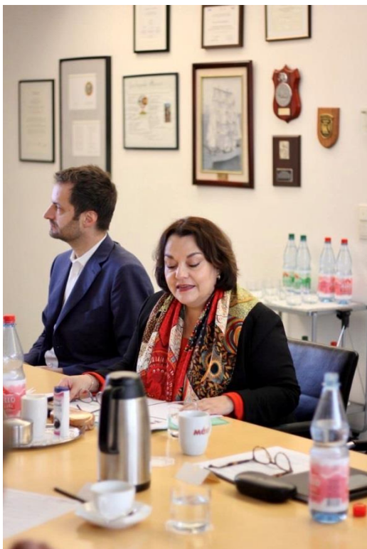
Cónsul Cecilia Villanueva Bracho.