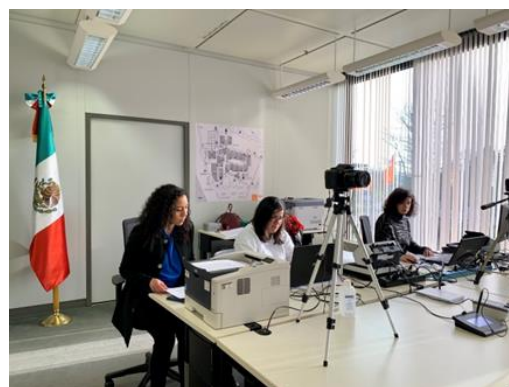
Personal del Consulado de México en Frankfurt.