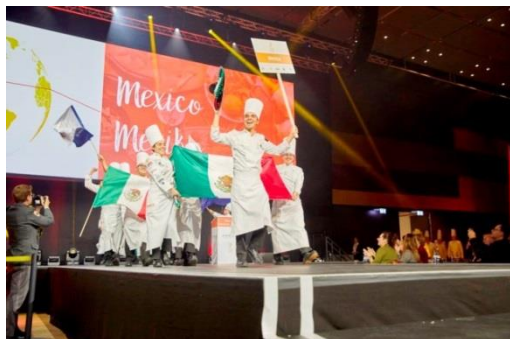
Participación de México en la Olimpiada Culinaria IKA 2020.