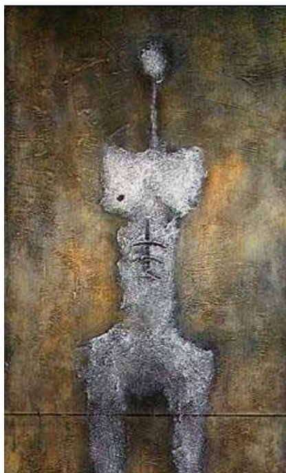
Cuadro de la serie Humano Eterno