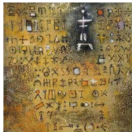
Cuadro serie Signos y Huellas