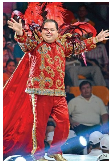
Rey de la alegría, carnaval de Veracruz.

Por otro lado, en el Pacífico mexicano, el Carnaval de Mazatlán comienza cinco días antes del Miércoles de Ceniza. Este es el carnaval mexicano que cuenta con la junta civil organizada más antigua, ya que la creación del comité data de 1898. En la actualidad los días del carnaval son días de asueto. En lugar de la marimba y el danzón, en el carnaval de Mazatlán se escucha la tambora y las bandas de la “onda grupera” invaden la ciudad. Igual que en otros carnavales, en Mazatlán se corona a la reina del carnaval y desde 1968, se elige a la reina infantil.