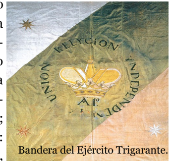
Bandera del Ejército Trigarante.

Fue en este momento cuando se institucionaliza el uso de la bandera tricolor. Este suceso histórico permitió asignar a cada color un primer significado: Verde: Independencia; blanco: Religión; rojo: Unión. Posteriormente,