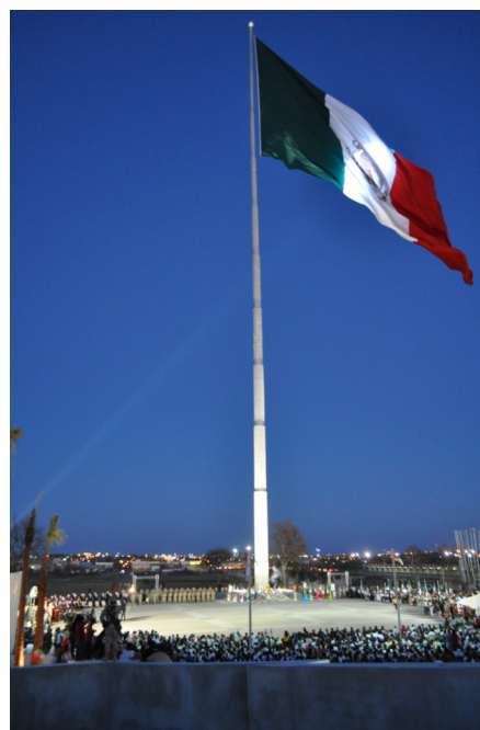
Bandera monumental de Piedras Negras, Coahuila.

http://www.diputados.gob.mx/LeyesBiblio/pdf/213.pdf