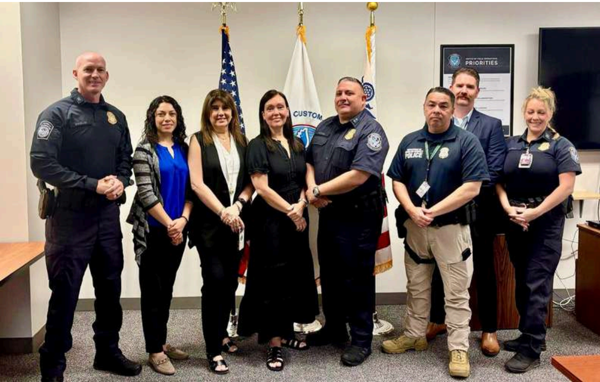
Foto: Reunión en el Aeropuerto Internacional Harry Reid, con funcionarios de TSA, CBP Y HSI, para abordar temas claves en la protección de la comunidad en Nevada.