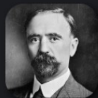
FRANCISCO I. MADERO