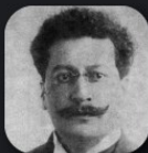
RICARDO FLORES MAGÓN