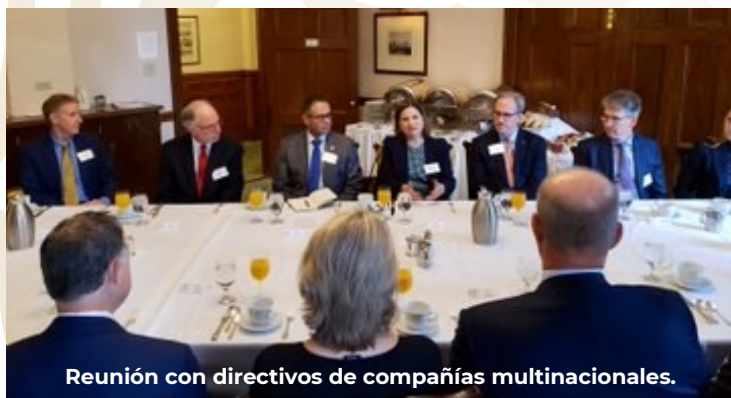
Reunión con directivos de compañías multinacionales.

Por otra parte, sostuvo encuentros con directivos de compañías multinacionales con fuerte presencia en México, entre las que destacan 3M, Cargill, Delta Air Lines, General Mills, Fredrickson and Byron, Ecolab, Donaldson y Medtronic.