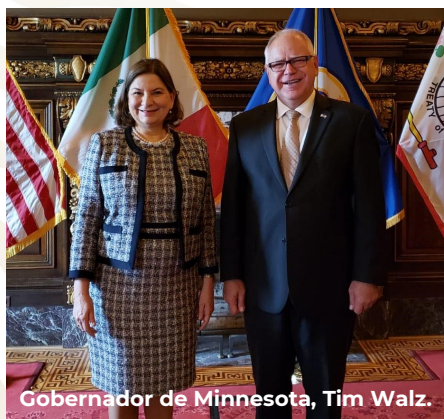
Gobernador de Minnesota, Tim Walz.