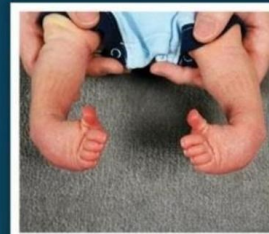
Afecciones de los pies