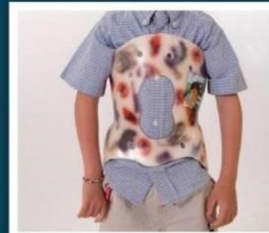
Afecciones de la columna vertebral