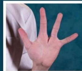
Afecciones de las manos