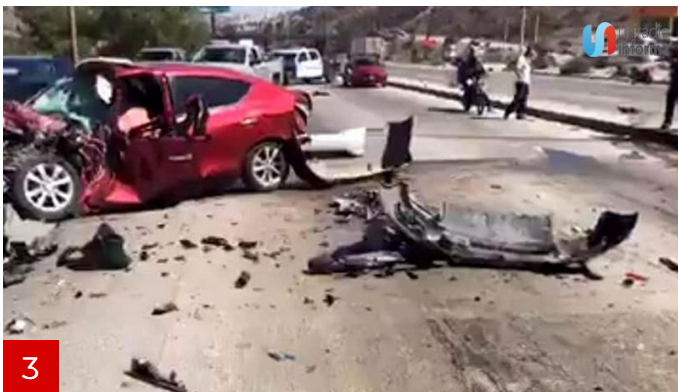
FOTOS: Fatal choque en 'la libre Tijuana-Rosarito'