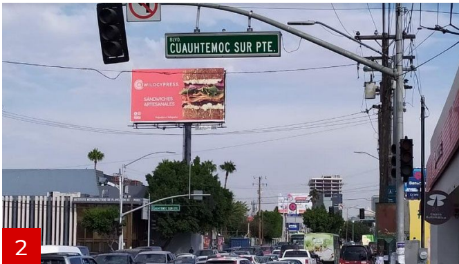
Más de 300 mil usuarios afectados por mega-apagón en Baja California