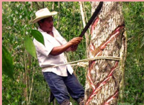
Árbol del chicle