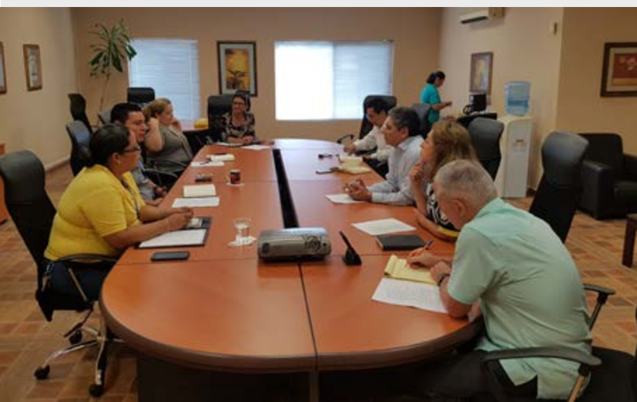
Reunión entre personal de Migración y del Consulado

Agregarón, que los interesados deberán contar con un abogado a efecto de proceder a su regularización migratoria, en las oficinas de migración en Tegucigalpa, con el fin de solicitar un permiso especial de permanencia o una residencia permanente.