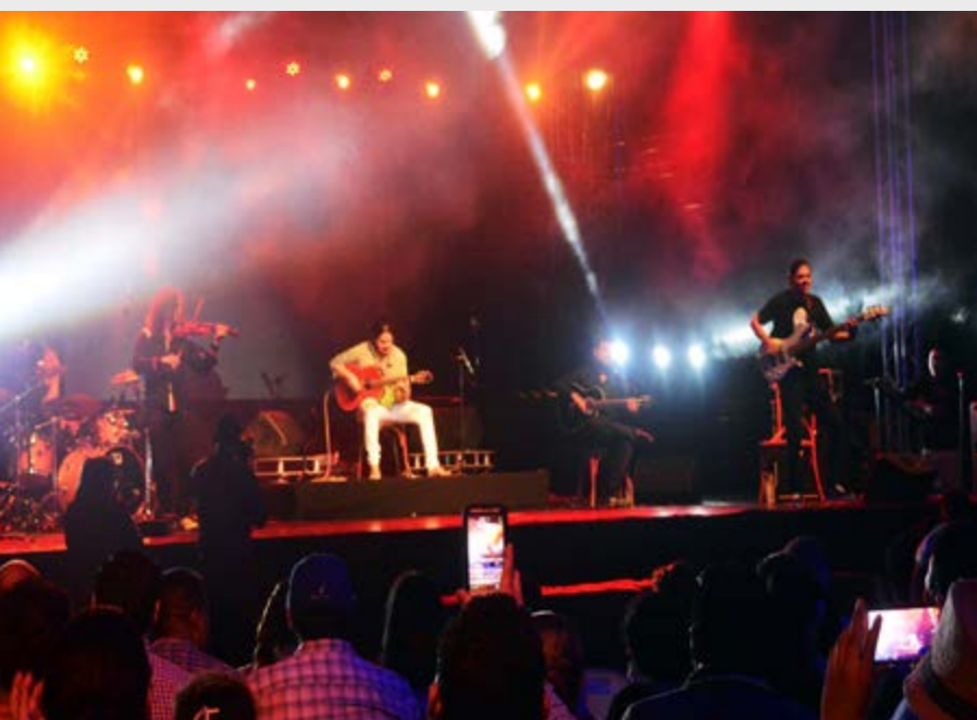
Paco Rentería en el Parque México

La promoción cultural ocupa un lugar relevante en la agenda del Consulado de México en San Pedro Sula, como un instrumento de comunicación y amistad entre dos países como son México y Honduras. En este contexto, a invitación del Consulado de México se presentaron tres conciertos del guitarrista mexicano Paco Rentería, acompañado por su grupo, en San Pedro Sula.