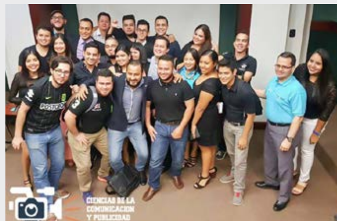
Alumnos de la carrera de Ciencias de la Comunicación y Publicidad.

Actualmente se está desarrollando un proyecto en el cual se busca que alumnos de la USAP puedan asistir a Televisa México, buscando con ello adquirir mayores conocimientos aplicables a su carrera.