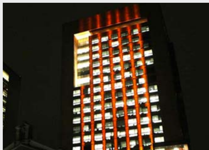
El edificio de la Secretaría de Relaciones Exteriores de México se pintó de naranja