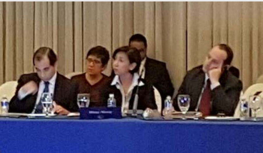
CRM: Delegación mexicana