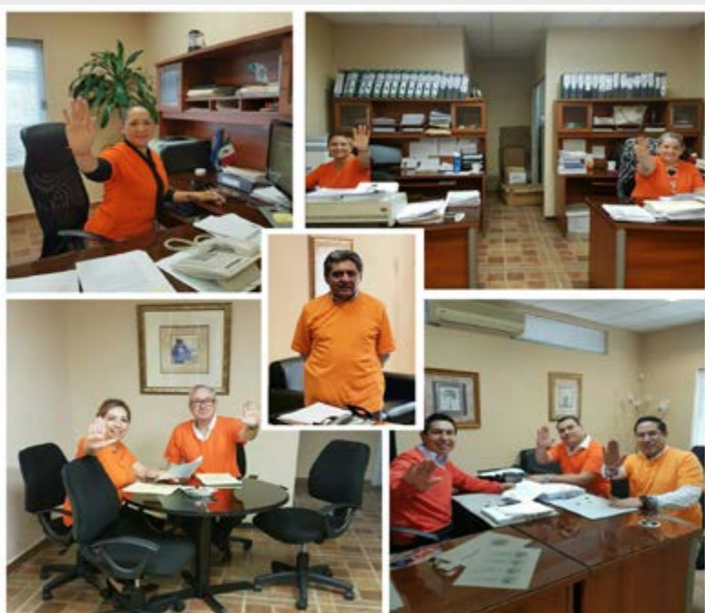
Personal del Consulado de México en San Pedro Sula

Por su parte, en 2008 el Secretario General de las Naciones Unidas, Ban Ki-moon, puso en marcha la campaña “Únete” para poner fin a la violencia contra las mujeres, aspira a movilizar a la opinión pública y a los gobiernos para prevenir y eliminar la violencia contra mujeres y niñas en todas las partes del mundo.