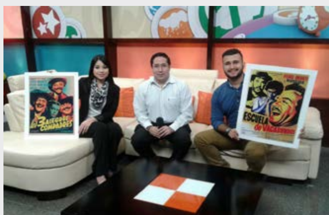
Mañana Mix, Campus TV