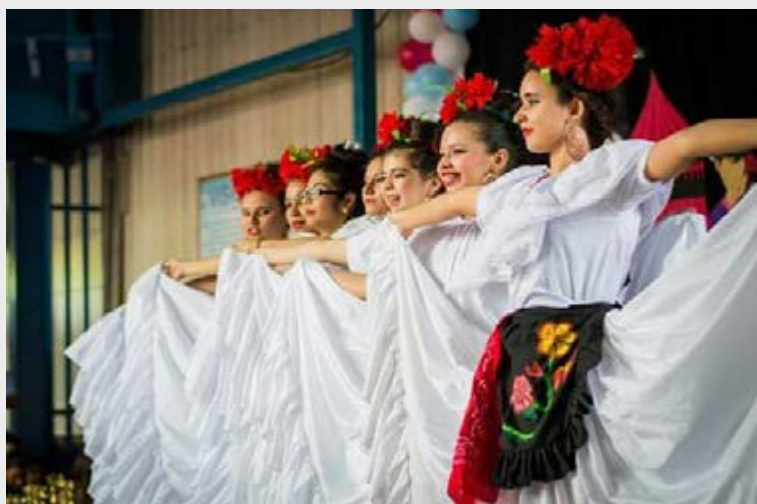
La Bruja, baile de Veracruz

En el marco del acercamiento del Consulado con planteles educativos y sectores juveniles y en función de fortalecer la presencia de México y promover sus valores culturales, el Cónsul titular participó como jurado en el “Festival Folklórico Internacional 2016-2017” donde se presentaron diversas culturas del mundo, mediante pabellones, gastronomía y bailes folklóricos. Participaron pabellones de China, Japón y Corea; Sudáfrica, Kenia y Madagascar; Colombia, México, Perú y República Dominicana. México se hizo acreedor al primer lugar en el montaje del pabellón cultural, premio que compartió con Colombia. En danza folklórica obtuvo también el primer lugar con la Danza de los Viejitos y bailes regionales de Veracruz... ¡Felicidades!