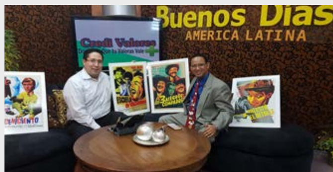
Buenos días América Latina, JBN

El diario.hn, electrónico, publicó “Dictan ponencia a favor de la salud en el Consulado de México” y Un vistazo a la historia “Por un amor” por el Día Internacional de la Mujer. También publicó “90 carteles clásicos del cine mexicano” y “Mexicanos conmemoran CCXI natalicio de Benito Juárez en San Pedro Sula”. El diario “La Prensa”, de San Pedro Sula, publicó “Honor al Benemérito de las Américas”, alusivo al Natalicio de Benito Juárez y “Carteles narran la época del cine mexicano”.