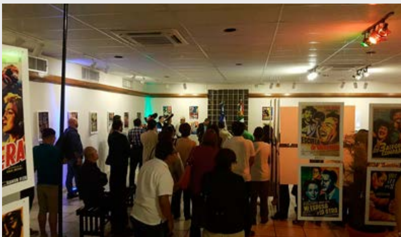
Galería del Centro Cultural Sampedrano (CCS)

-> Ver nota de eldiario.hn <- -> Ver nota de La Prensa <- -> Ver video del Consulado <-