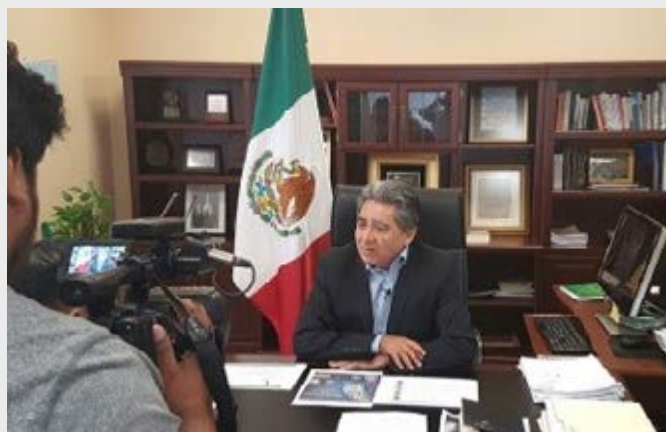
Teleprogreso en el Consulado