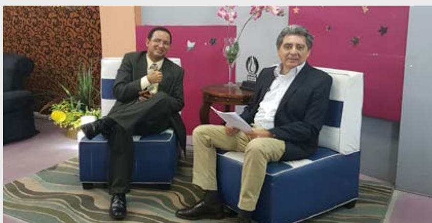
Buenos días América Latina, JBN

Asimismo, el Consulado participó en diferentes programas de televisión y radio, entre los que se encuentran “Buenos Días América Latina”, de la televisora JBN; Mañana Mix, de CampusTv; Esta Mañana, de Canal 11 y se recibió a Teleprogreso en las instalaciones del Consulado, con el fin de difundir particularmente los eventos que se realizaron con motivo del CCXI Aniversario del Natalicio de Benito Juárez, del Día Internacional de la Mujer y sobre la exposición de “Carteles de Cine de México”, realizada conjuntamente con el Centro Cultural Sampedrano (CCS).