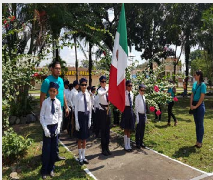
Escolta de Bandera de la “Escuela República de México” ubicada en Altos de Cofradía