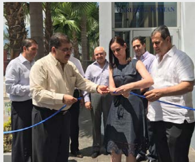
Inauguración de nueva oficina de la ACCS