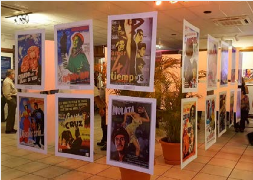
Exposición "Carteles de Cine en México"

El 22 de marzo el Consulado de México conjuntamente con el Centro Cultural Sampedrano (CCS) inauguraron la exposición "Carteles del Cine en México", integrada por una selección de 90 carteles, representativos de la Época de Oro del Cine en México. La exposición estará abierta al público hasta el 5 de abril del año en curso.