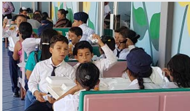
Pequeños en el museo

Estudiantes de la “Escuela República de México”, ubicada en Altos de Cofradía, hicieron una visita al Museo para la Infancia “El Pequeño Sula”, donde pudieron admirar y disfrutar de las diversas actividades que ofrece ese museo con las salas de La Caverna, réplica de las cuevas de Taulabé en Honduras y la recreación de hormigas, murciélagos y alacranes, característicos de ese sitio; la Aventura Jurásica que exhibe al Tiranosaurio Rex; El Planetario, un viaje a la Luna y Marte; y El Bosque.