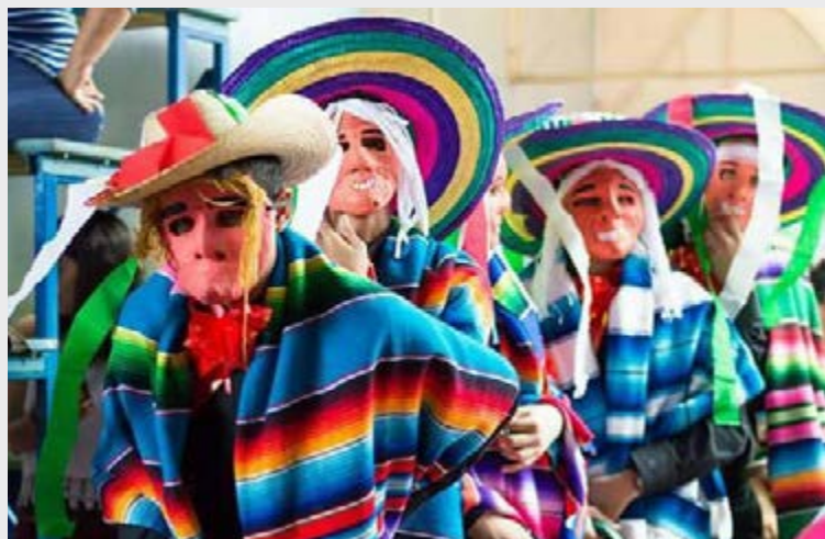
Los Viejitos, danza de Michoacán