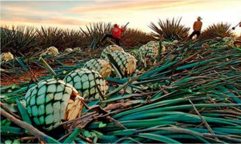
El tequila fue el primer producto mexicano en obtener la Denominación de Origen

México, al igual que otros países, protege sus productos que cuentan con calidad y características únicas así como exclusividad de un medio geográfico, otorgándole la Denominación de Origen .