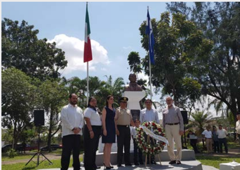
CCXI Aniversario del Natalicio de Benito Juárez, Parque México

El Consulado de México realizó en el Parque México de la ciudad de San Pedro Sula, un evento para conmemorar el CCXI Aniversario del Natalicio de Benito Juárez. En la ceremonia participó una escolta conformada por niños de la “Escuela República de México”, ubicada en Altos de Cofradía, Cortés, miembros de la comunidad mexicana y del cuerpo consular y la Banda de Guerra de la 105 Brigada.