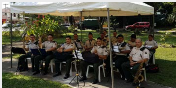
Banda Marcial de la 105 Brigada de Infantería

Sus ideales lo llevaron a prisión en múltiples ocasiones y al exilio. Con la creación de las Leyes de Reforma dio un giro a la Historia de la República Mexicana. Realizadas en conjunto con Juan Álvarez e Ignacio Comonfort se incluyeron en la Constitución Federal de los Estados Unidos de 1857, en éstas se estableció la enajenación de los bienes no aprovechados de la iglesia y la separación de la iglesia y del ejército en los asuntos civiles; su obra fundamenta el desarrollo de la legalidad y de la defensa del Estado de Derecho.