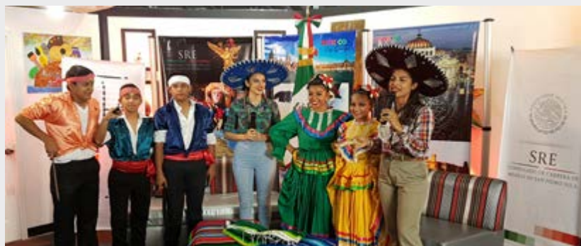
Folklor mexicano, Ballet Folklórico Dancestros, W Tv