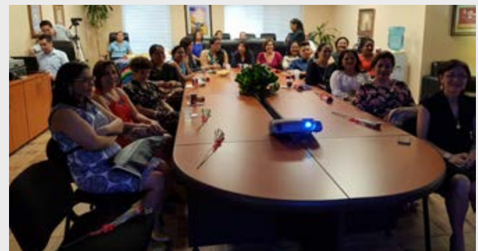
Consulado de México