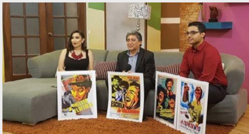
Esta mañana, Canal 11