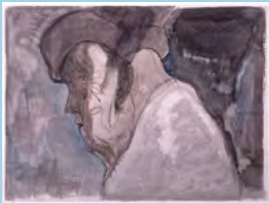
Celestina (tinta china, acuarela)

Los críticos de arte dicen que su obra desnuda las almas de sus personajes, en los que retrata la profundidad de la degradación humana. Es uno de los destacados representantes del Neofigurativismo.