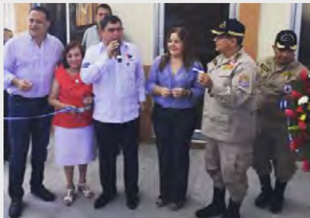
Autoridades y socorristas

Esta antigua estación fue construida hace setenta años. La inversión para su remodelación rondó los 3.8 millones de lempiras, misma que beneficiará a más de medio millón de habitantes.