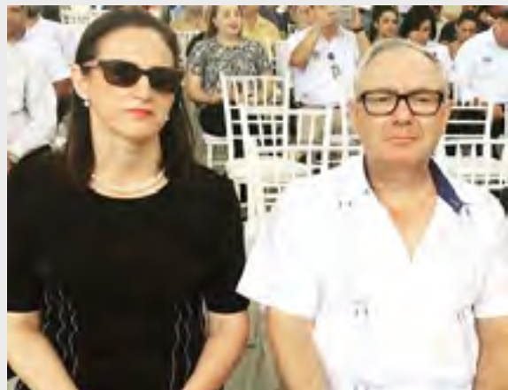
Cónsul de España, María Isabel Rodríguez, y Cónsul de México, Federico Chabaud.

El Alcalde Armando Calidonio informó que en los últimos años la municipalidad ha dado una alta prioridad a la modernización de las instalaciones de bomberos en San Pedro Sula. Dijo que en 2015 la Corporación Municipal destinó 41.6 millones de lempiras al cuerpo de bomberos y en 2016 se habría entregado 62.4 millones. En 2013 la Municipalidad habría transferido a esa Institución 11.9 millones y en 2014 una suma de 42.5 millones.