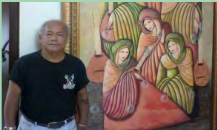
Maestro César Milla

El Congreso Nacional de la República de Honduras otorgó, el 11 de julio, el Premio a la Identidad Nacional 2017 al destacado pintor sampedrano César Milla, por su trayectoria de 42 años y cuyas obras han puesto en alto el nombre de Honduras en el extranjero.