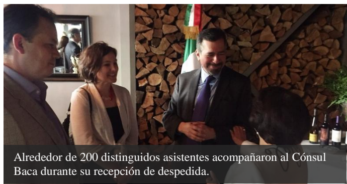
Alrededor de 200 distinguidos asistentes acompañaron al Cónsul Baca durante su recepción de despedida.

Durante el mes de junio, el Ministro Eduardo Baca Cuenca realizó una serie de reuniones y eventos con el objetivo de despedirse de la comunidad mexicana en el estado de Washington, así como de autoridades locales, medios de comunicación y organizaciones e instituciones aliadas al finalizar su gestión como Cónsul de México en Seattle después de 3 años en el cargo.