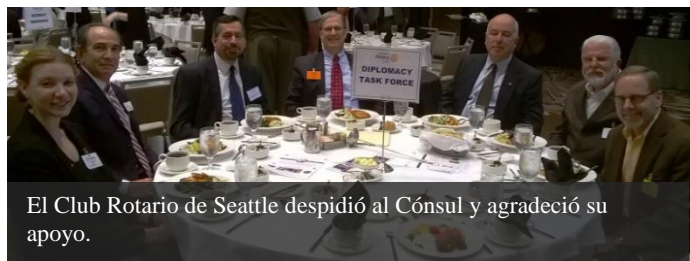
El Club Rotario de Seattle despidió al Cónsul y agradeció su apoyo.

Asimismo, el Club Rotario de Seattle, el más grande de una ciudad en los Estados Unidos, despidió al Cónsul Baca Cuenca, agradeciéndole su labor en pro de las relaciones entre Washington y México. En particular, se hizo mención a su contribución para establecer nuevos nexos entre la comunidad consular en el estado y el citado capítulo de Rotarios.