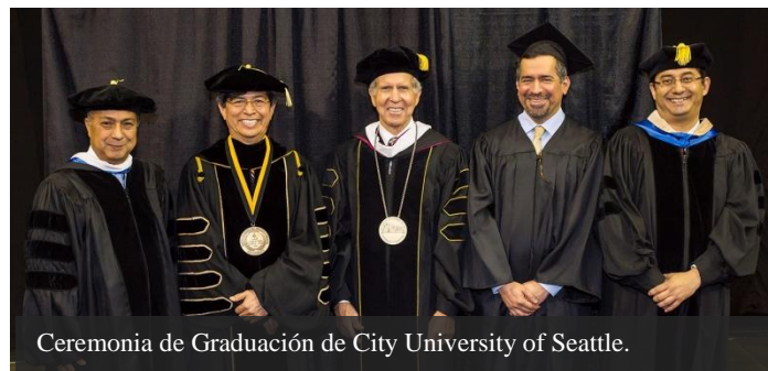
Ceremonia de Graduación de City University of Seattle.