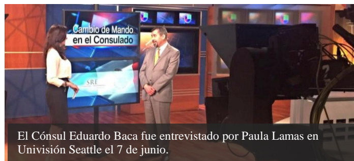
El Cónsul Eduardo Baca fue entrevistado por Paula Lamas en Univisión Seattle el 7 de junio.

Así, visitó el noticiero de Univisión Seattle el 7 de junio en donde habló de los resultados de su gestión al frente del Consulado.