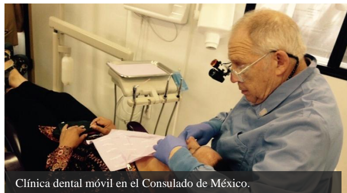
Clínica dental móvil en el Consulado de México.

Durante mayo y junio el Consulado de México en Seattle en colaboración con Medical Teams International , instaló una clínica dental móvil en la parte exterior de las instalaciones del Consulado.