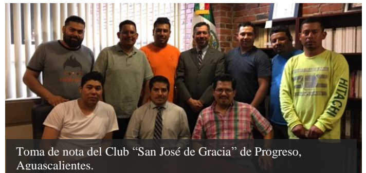
Toma de nota del Club “San José de Gracia” de Progreso, Aguascalientes.