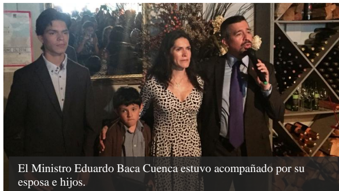
El Ministro Eduardo Baca Cuenca estuvo acompañado por su esposa e hijos.

Durante el mes de junio, el Ministro Eduardo Baca Cuenca realizó una serie de reuniones y eventos con el objetivo de despedirse de la comunidad mexicana en el estado de Washington, así como de autoridades locales, medios de comunicación y organizaciones e instituciones aliadas al finalizar su gestión como Cónsul de México en Seattle después de 3 años en el cargo.