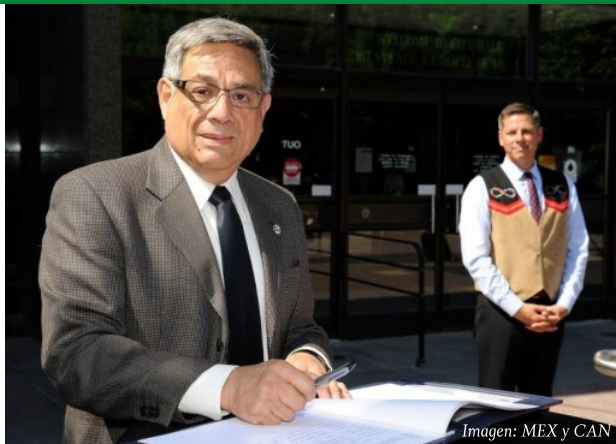
Imagen: MEX y CAN